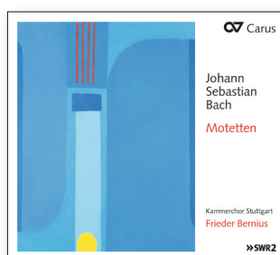
Carus 83.298 (SACD)