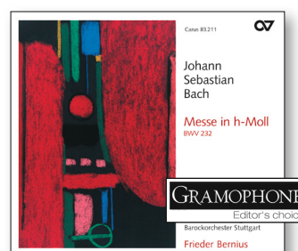
Carus 83.211 (2 CDs)