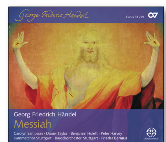
Carus 83.219 (2 SACDs)